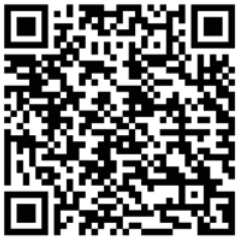
Anmeldung zum LLWB