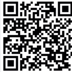
Anmeldung zur Goldenen Schere